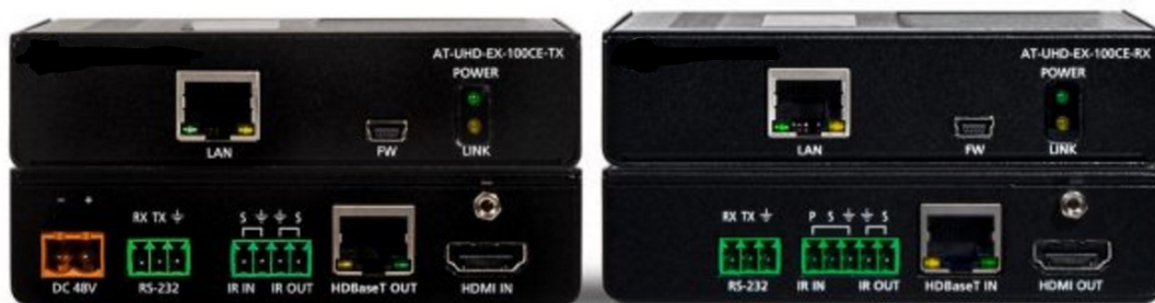
Extendery zdjęcie poglądowe

Wszystkie połączenia sygnałów wideo w przestrzeni Sali wykonane są przy pomocy przyłączy PP oraz Pm wyposażone w gniazda 2xRJ45 oraz 2 gniazda zasilania 230V. Do gniazd należy doprowadzić zasilanie – nie objęte niniejszym opracowaniem.